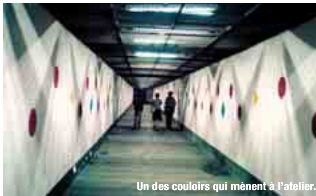
Un des couloirs qui mènent à l'atelier.

et sur un espace large comme la salle d'échange métro-RER de la Défense, un tunnel de béton infini, en parfait état. L'existence de cet espace libre est une chance pour l'Epad, qui espère en faire la